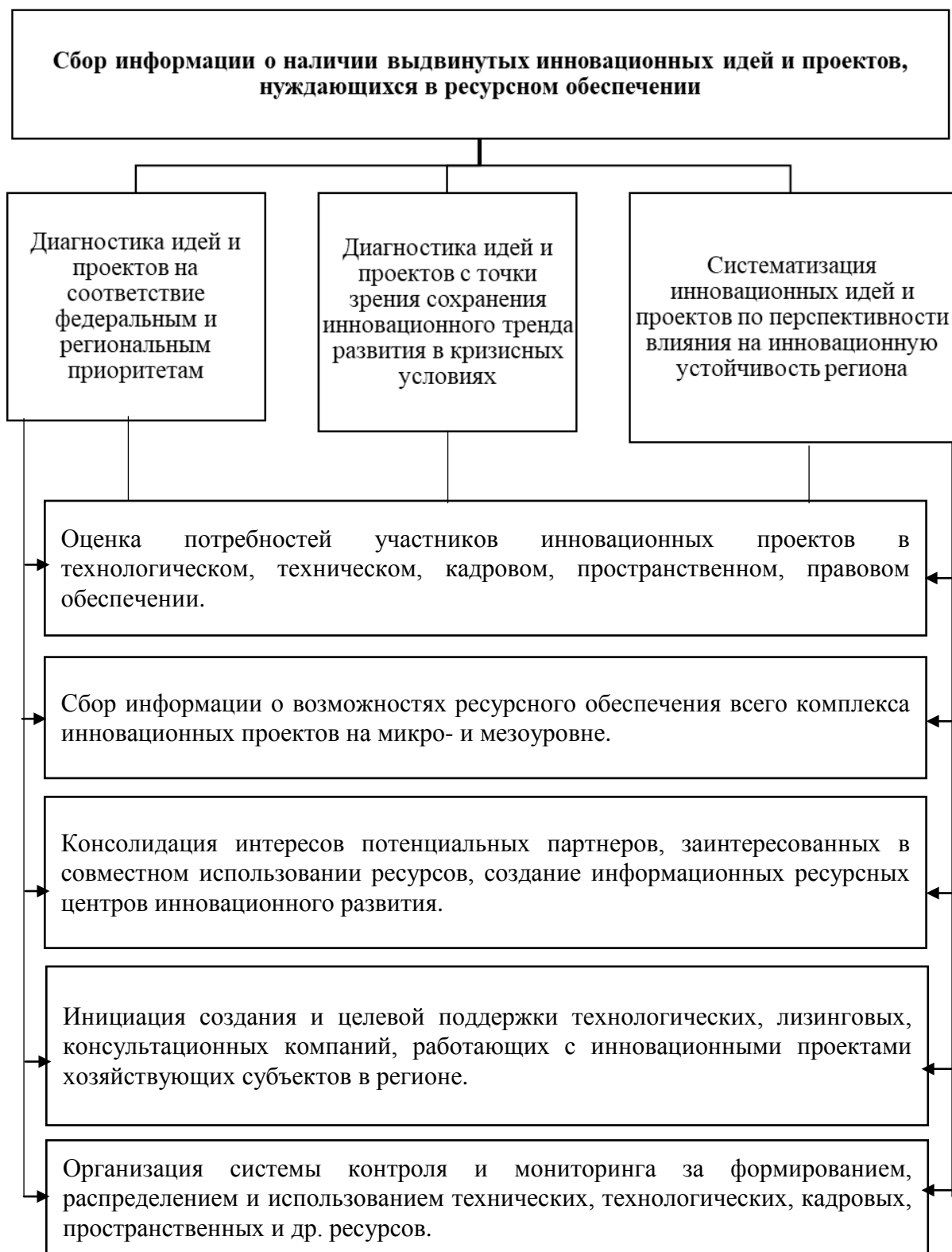
Рисунок 2. Алгоритм обеспечения ресурсного равенства инновационных проектов в регионе 15